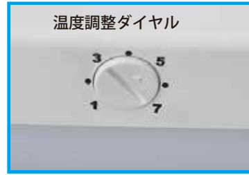
温度調整ダイヤル